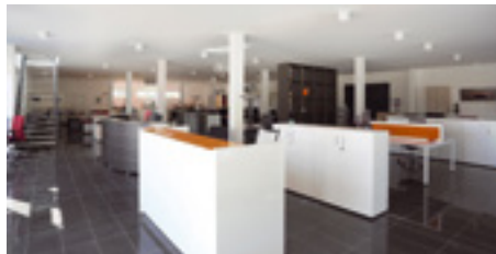
Gebrauchte und neue Büromöbel auf 2.000 Quadratmetern über 2 Etagen

Unsere Lager sind voll mit direkt lieferbarer Ware, wofür unsere Kunden sehr dankbar sind.“ Natürlich gibt G+P auf alle Möbel, die das Haus verlassen, eine Garantie.